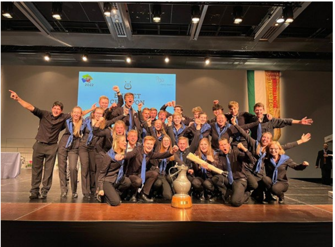
Siegerformation BBO-Junior in der 2. Klasse am SBBW in Montreux